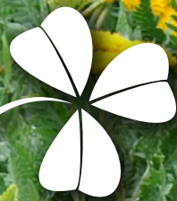
Lauréat 2018